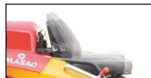
Reglaje del volante y asiento