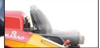
Reglaje del volante y asiento